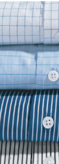
CUADRO BLANCO (BOO)