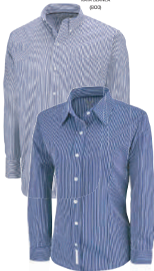
RAYA BLANCA (BOO)