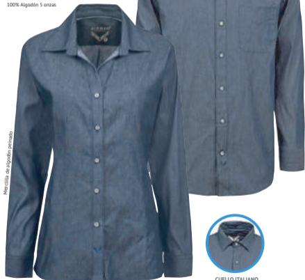
AZUL STONE (AZ6)