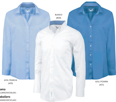
AZUL FRANCIA (AZ0)